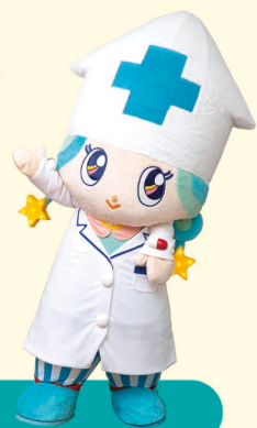
富山県薬剤師会マスコットキャラクター 富薬(とみやく)ヒカリちゃん

応募方法 下記いずれかの方法にてご応募ください ※応募作品は一人一点までとさせていただきます