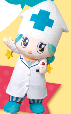
富山県薬剤師会マスコットキャラクター 富薬(とみやく)ヒカリちゃん